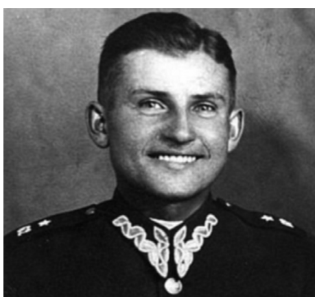
Płk. Łukasz Ciepliński ps. „Pług”, prezes IV Zarządu Głównego WiN

Łukasz Ciepliński (1913-1951) ps. „Pług” „Ostrowski”, „Apk”, „Bogdan”, „Grzmot”, „Ludwik”.