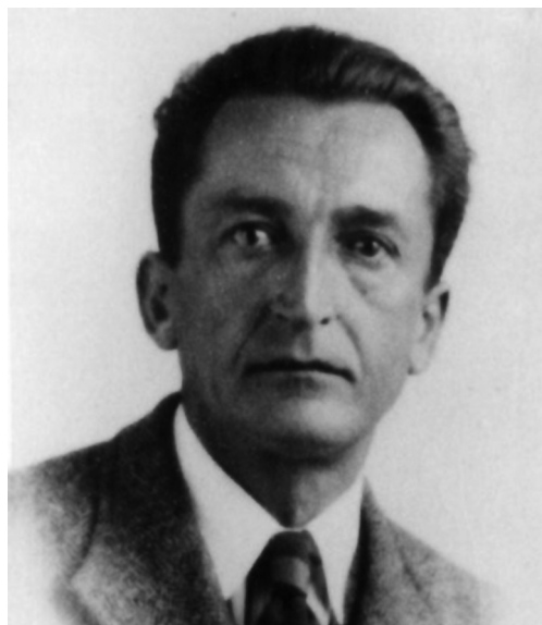
Gen. August Emil Fieldorf ps. „Nil”