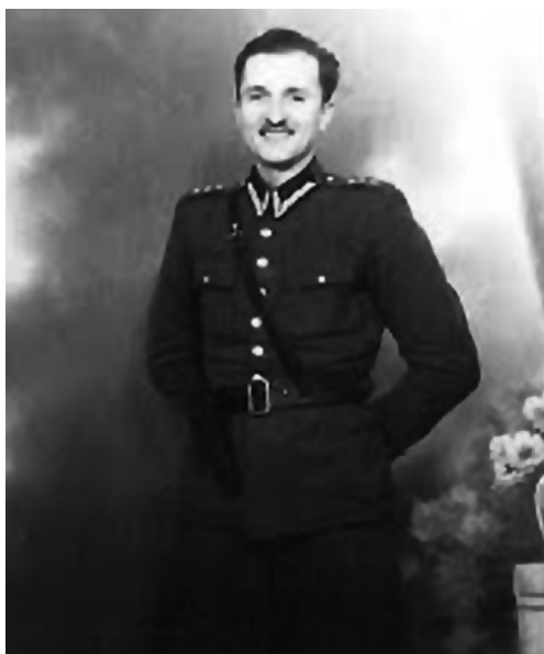
Kpt. Henryk Kamiński ps. „Huzar”

Szczelny kordon, czyli granica dzieląca PRL i Kresy uniemożliwiał wspólne działania. Na ziemiach od granicy ryskiej, aż po Odrę i Nysę Łużycką w latach 1944-47