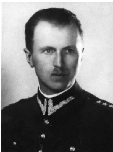
Ppłk dypl. saperów inż. Maciej Kalenkiewicz, ps. „Kotwicz”