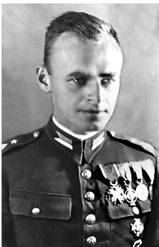
Rotmistrz Witold Pilecki ps. „Witold”

Witold Pilecki (1901-1948) ps. „Witold”, „Tomek”, „Tomasz Serafiński”.