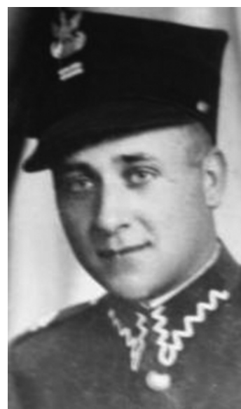
Sierż. Józef Franczak ps. „Lalek”

Bezpieka za wszelką cenę próbowała go pojmać. Obserwowano rodzinę, znajomych, zakładano podsłuchy, kontrolowano korespondencję, werbowano konfidentów. W 1961 roku zamieszczono list gończy w lokalnym „Kurierze Lubelskim”. Dwa lata