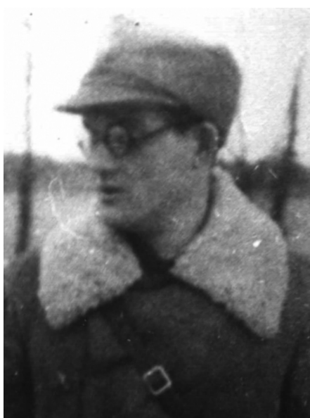
Czesław Zajączkowski ps. „Ragner”, „Ragnar”, zwany przez Sowietów „diabłem w okularach”

Czesław Zajączkowski (1917-1944) ps. Ragner”, „Ragnar”.