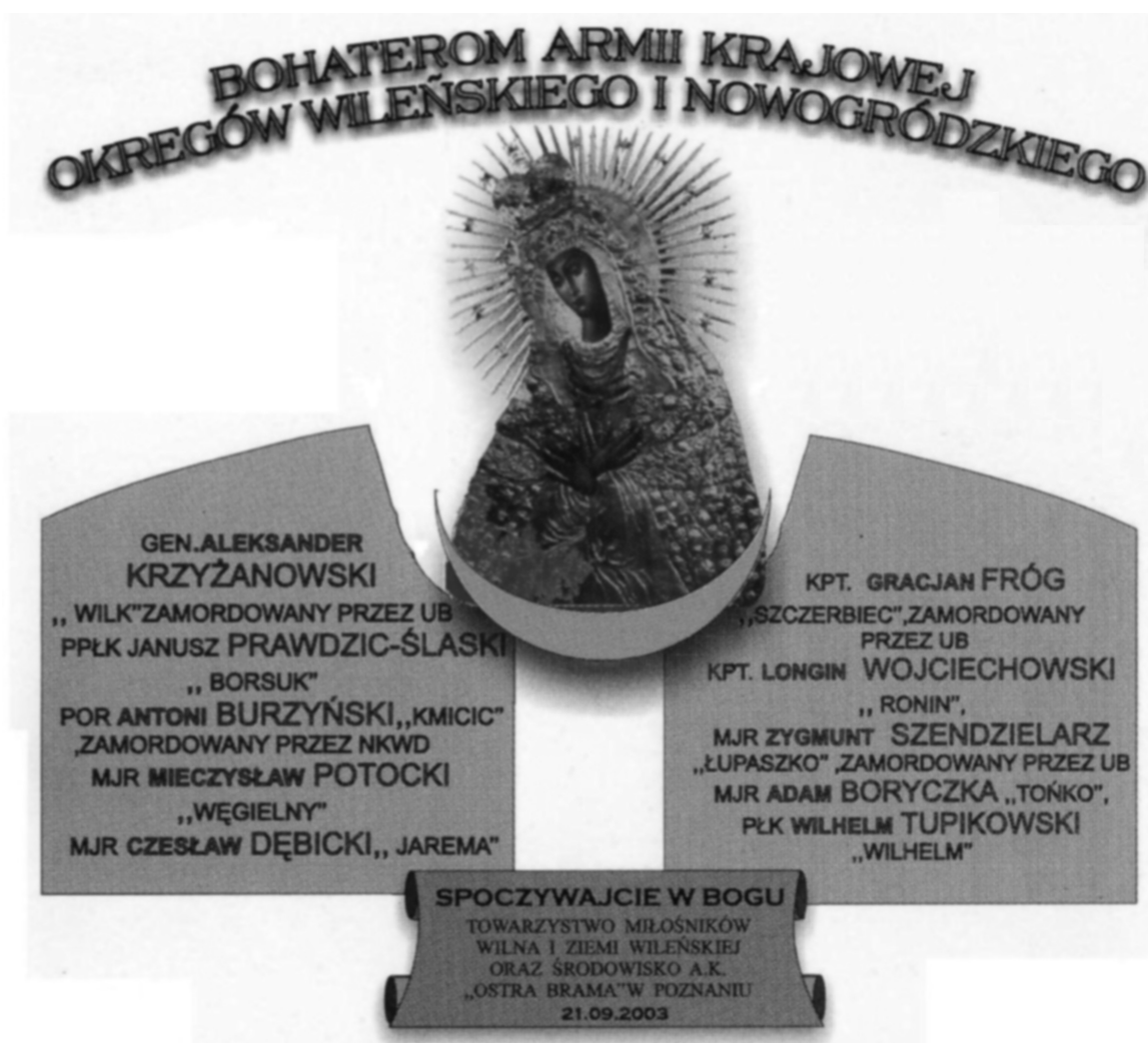
Tablica pamiątkowa przed kościołem św. Wojciecha w Poznaniu.

Po jego śmierci wciąż odnotowywano wystąpienia zbrojne polskiego podziemia. Ostatni leśni trwali na swych kresowych posterunkach do 1953 roku.