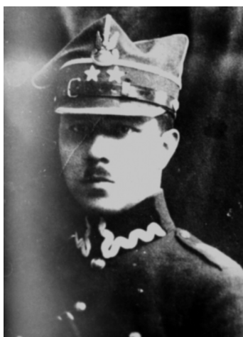
Andrzej Rzewuski ps. „Abrek”, „Fok”, „Zagończy”, „Wojmir”, „Hańcza”

Aresztowany 11 V 1946 r. w Grudziądzu. Przetrzymany przez UB we Włocławku, WUBP w Łodzi, a od 16 lipca 1946 r. w WUBP w Poznaniu. 18 listopada 1946 r. skazany na karę śmierci. Wyrok wykonano przez rozstrzelanie w Poznaniu dnia 31 stycznia 1947 r. o godz. 15-tej.