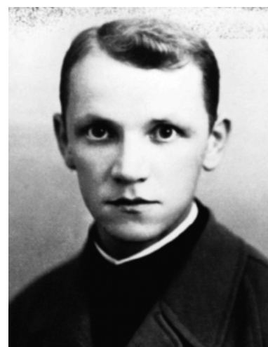
Ks. Władysław Gurgacz ps. „Sem”