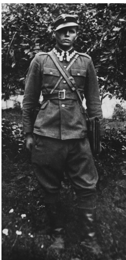
Por. Jan Kempiański ps. „Błysk”