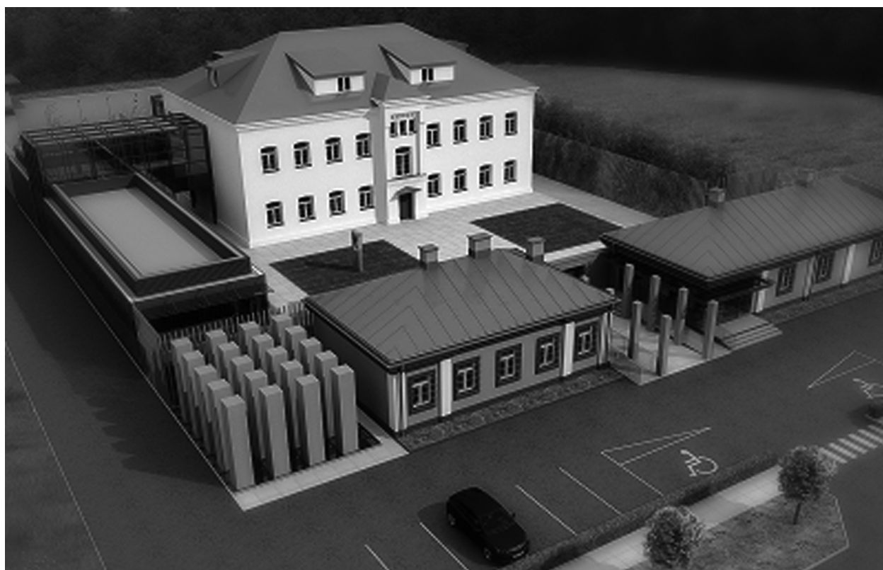
Muzeum Żołnierzy Wyklętych w Ostrołęce, wizualizacja

Muzeum powstaje w regionie, gdzie opór społeczeństwa i działalność ugrupowań antykomunistycznych spod znaku NZW i AK – WiN przyjęły bardzo duże rozmiary. W początkowym okresie w podziemiu zaprzysiężonych było ponad 3500 żołnierzy